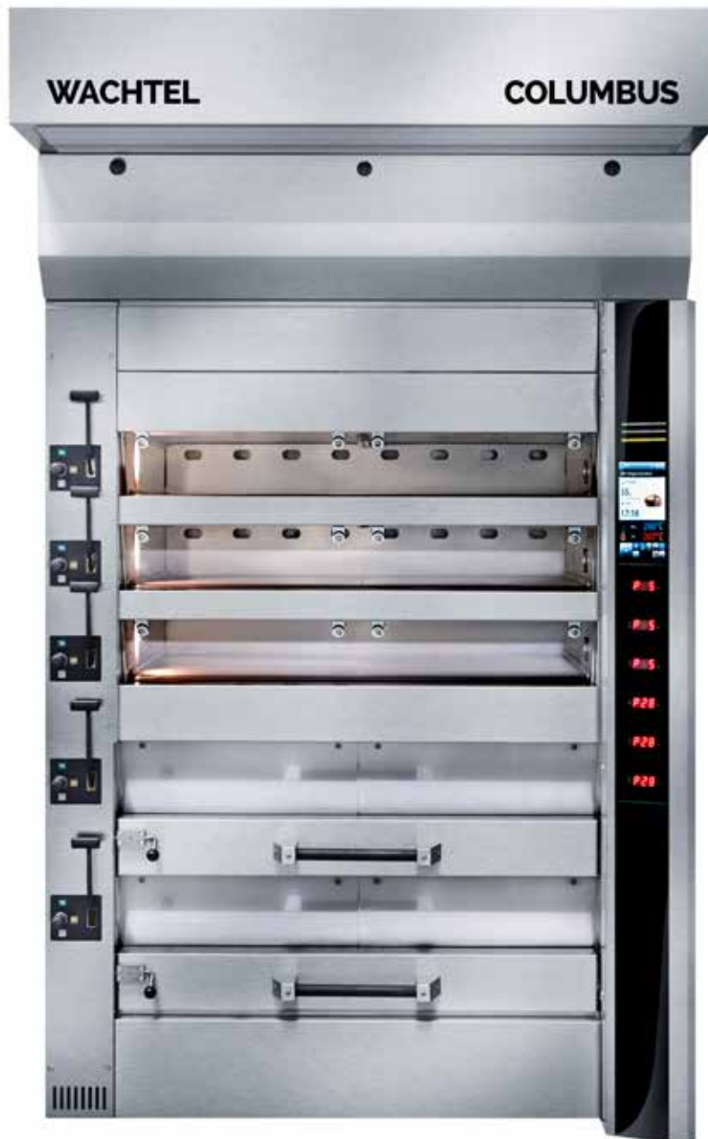
COLUMBUS CO 520/180 V A2