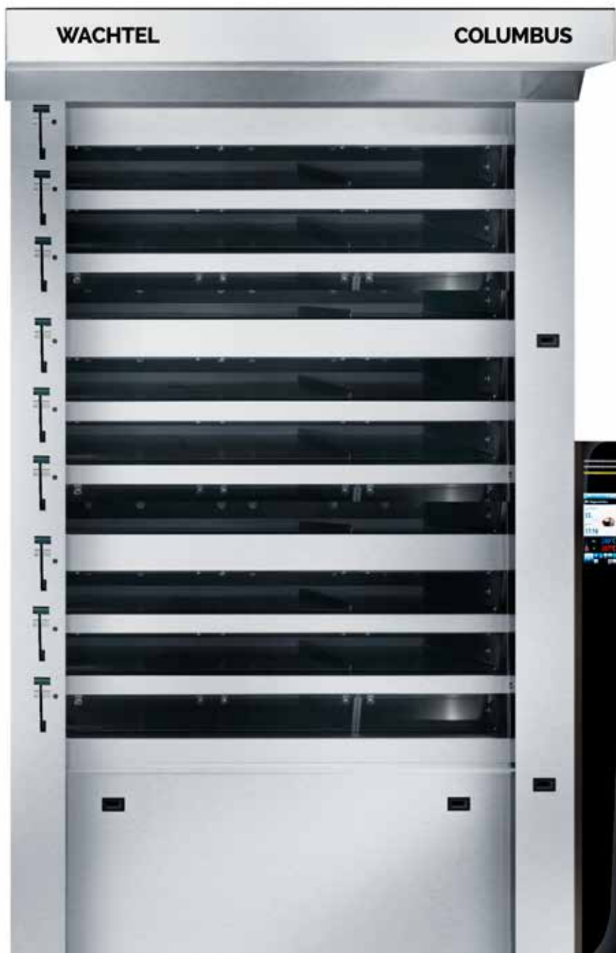
COLUMBUS E 924/432 T COMFORT Площадь выпечки : 44 м 2 (Ш: 2,0 м / Г : 2,4м)