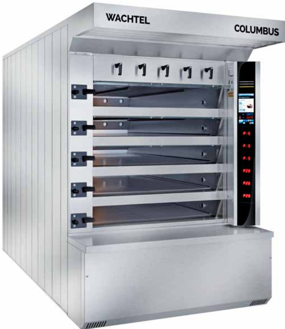
COLUMBUS C 520/120 M

COLUMBUS MONO – одна температура для всех подов